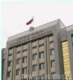
Флаг РФ на здании Счётной Палаты