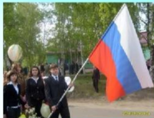
Мы используем Флаг РФ на митинге-шествии 9 Мая