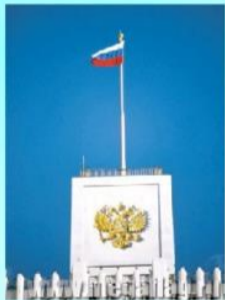
Флаг РФ над Домом Правительства